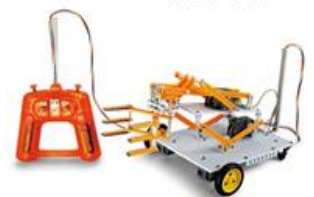
武者ロボのベースマシン