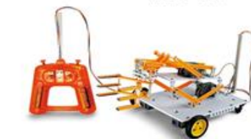
武者ロボのベースマシン